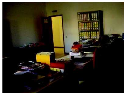
Figura 5 – Gabinete de Formação Cultural e Desporto