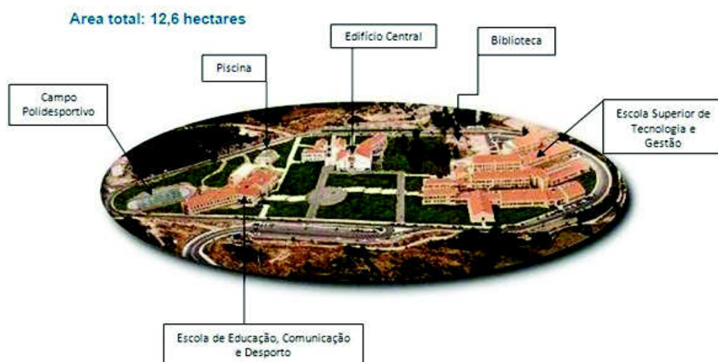
Figura 4 – Campus do IPG

Na sua estrutura organizacional, o IPG é constituído por um Presidente, um Vice-Presidente e um Administrador, além do Concelho Geral e do Concelho Administrativo. Todos estes órgãos e os restantes poderão ser consultados no organograma institucional do IPG no anexo deste documento. São unidades orgânicas do Instituto os Serviços de Acção Social (SAS), a Escola Superior de Turismo e Hotelaria (ESTH), que se encontra localizada em Seia, a Escola Superior de Tecnologia e Gestão (ESTG), a Escola Superior de Saúde (ESS) localizada junto ao Hospital Sousa Martins e a Escola de Educação, Comunicação e Desporto (ESECD).