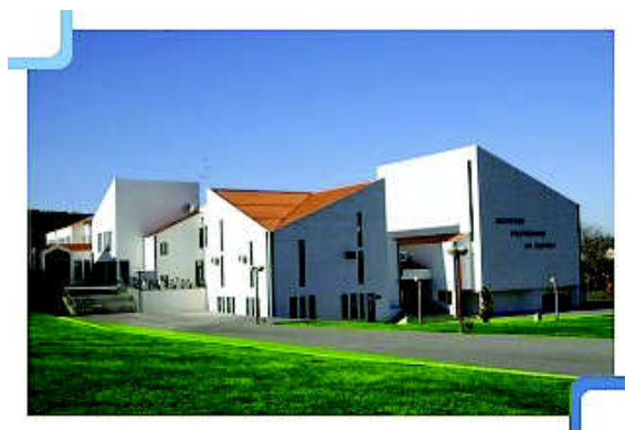
Figura 2 – Edifício Central do IPG. 4

Desenvolve também actividades nos domínios da investigação (quer nas Escolas, quer na unidade de I&D), da transferência e valorização do conhecimento científico e tecnológico, da prestação de serviços à comunidade, de apoio ao desenvolvimento e de cooperação em áreas de extensão educativa, cultural e técnica. Deste modo, o IPG desempenha um papel decisivo na qualificação dos recursos humanos, em diversas áreas do saber, na sua esfera de competências, bem como no desenvolvimento económico, social, científico e cultural da região da Guarda. 3