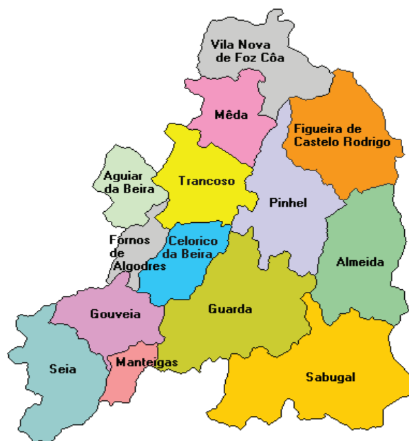
Figura 1 – Distrito da Guarda. 1

Caraterização da cidade da Guarda e o mapa do distrito.