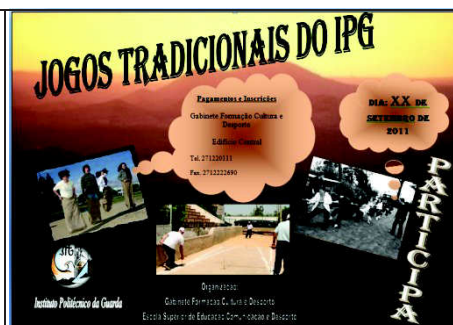
Figura 7 – Cartaz dos Jogos Tradicionais