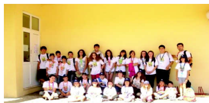
Figura 14 – Grupo da 2ª Semana

A componente prática deste evento implicou um acompanhamento das diferentes fases, desde reuniões para o planeamento, passando pelo trabalho de campo.