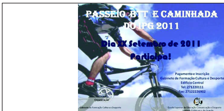
Figura 6 – Cartaz do Passeio de BTT e Caminhada

Em baixo apresento atividades organizadas ou vivenciadas por mim em conjunto com a minha colega estagiária, tais como a organização de eventos e ações de formação.