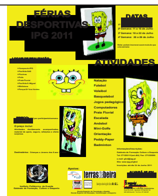
Figura 10 – Cartaz das Férias Desportivas