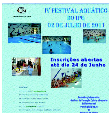
Figura 11 – IV festival Aquático 2011