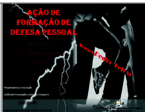
Figura 9 – Cartaz da Ação de Formação Defesa Pessoal