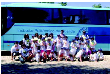
Figura 13 – Grupo da 1ª Semana

Aproveitando a oportunidade que este programa concedeu de se reunirem diferentes faixas etárias no mesmo espaço físico, permitiu então, vivenciar diferentes experiências, adquirir novos conhecimentos, sentir novas dificuldades e ter a certeza, que as crianças são os destinatários com os quais gostaria de um dia vir a trabalhar.