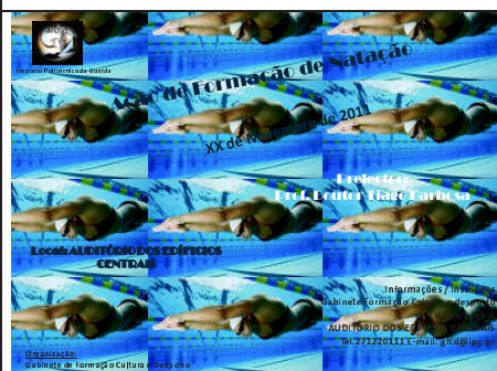
Figura 8 – Cartaz da Ação de Formação de Natação