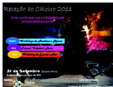
Figura 12 – Recepção ao Caloiro