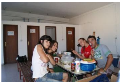
Ilustração 6 - Sala de refeições