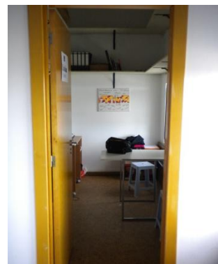
Ilustração 3 - Escritório da Escola

A 30SchoolDance apresenta um regulamento destinado aos encarregados de educação dos alunos envolvidos (ver anexo1), e outro destinado aos alunos participantes, (ver anexo2), apresenta ainda uma ficha de inscrição com todas as modalidades como opção (ver anexo3).