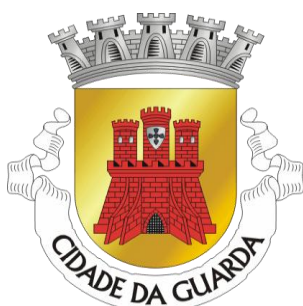
Ilustração 1 - Símbolo da cidade da Guarda

Este estágio foi realizado na cidade da Guarda, cidade esta conhecida como a mais alta de Portugal, encontra-se a 1056 metros de altura. A guarda engloba 52 freguesias rurais e 3 urbanas que acolhem uma população de 173 831 habitantes. O concelho da Guarda tem como vizinhos as terras de Celorico da Beira, Belmonte, Sabugal e Manteigas. Este estágio foi então, mais especificamente, realizado na 30ShoolDance.