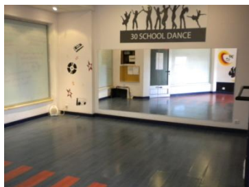
Ilustração 4 - Sala da 30SchoolDance (Espelho Grande)

A 30SchoolDance localiza-se no Centro Comercial Garden loja nº 6 do Largo de D. João, na Guarda. Esta escola oferece um espaço com cerca de 49 m 2 , contem dois espelhos, um individual e outro de grupo e tem ainda um escritório particular destinado á direcção.