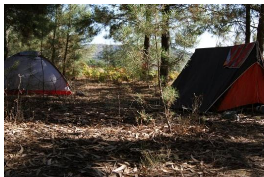
Ilustração 7 - Tendas de campismo

Este evento foi bem sucedido, não só por não ter havido despesas no final como também pelo agrado demonstrado por todos os participantes e pelo bom desempenho de cada um em todas as actividades propostas. Este será um evento para repetir não só pela nossa opinião como também pela dos participantes.