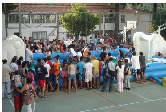
15. Matraquilhos Humanos