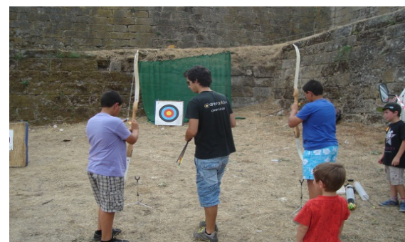
8. Tiro ao Arco