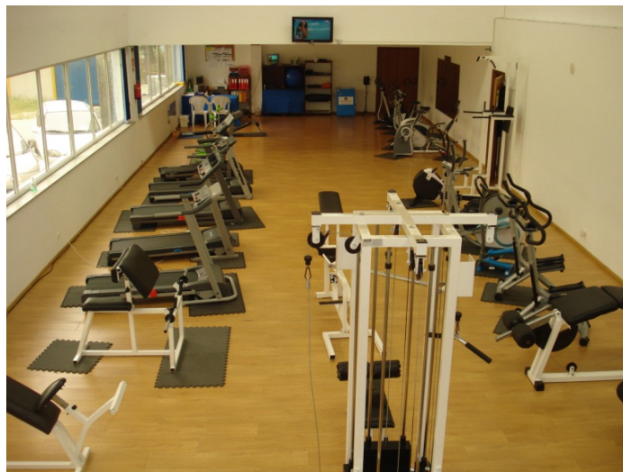
2.Ginásio da Mata