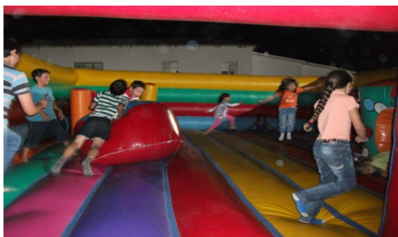
7. Insuflável Grande