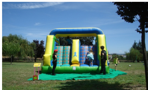
6. Insuflável médio