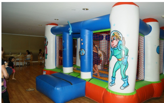
5. Insuflável pequeno

Quando as actividades desenvolvidas eram tiro. A nossa tarefa era fazer a manutenção dos marcadores e dos arcos lubrificá-las, e limpeza das máscaras utilizadas nos jogos de Paintball.