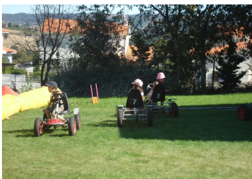
14. Pedal cars

Fizeram-se torneios de paintball com a participação de várias equipas no Ferro e em Casegas (Covilhã), torneio este que se prolongou por dois dias, jogos de Paintball entre grupos de amigos em Penamacor em Fornos de Algodres e em Almeida (Guarda), torneios de matraquilhos Humanos no, Ourondo (Covilhã), uma mega actividade com rappel, paintball, tiro ao alvo, pedalcars, insufláveis em Almeida.