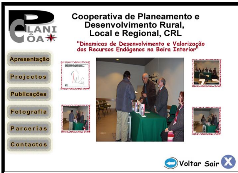
ILUSTRAÇÃO III- CD_ INTERACTIVO