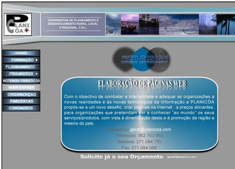
ILUSTRAÇÃO II- WWW.PLANICOA.COM (WEB DESIGN)