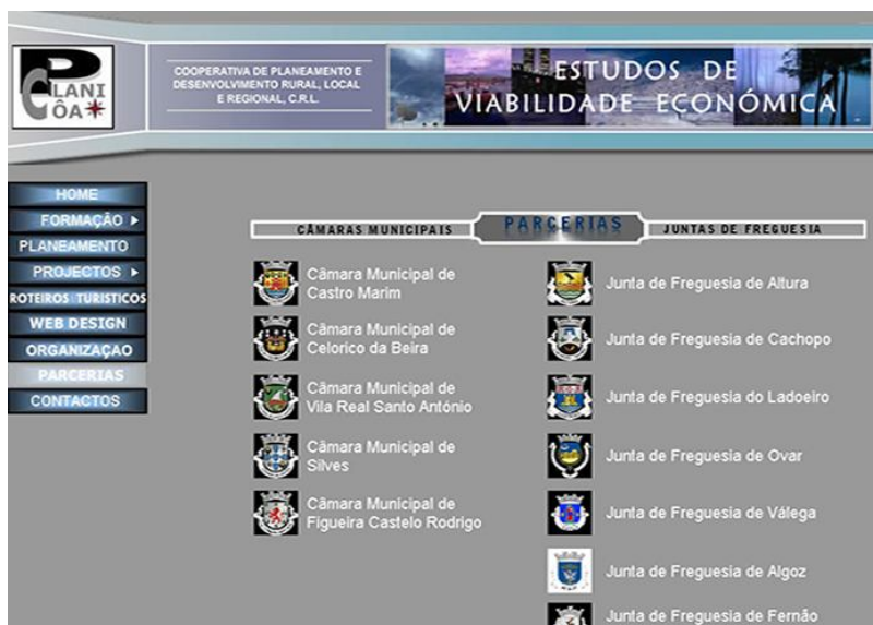
ILUSTRAÇÃO I- WWW.PLANICOA.COM (PARCERIAS)