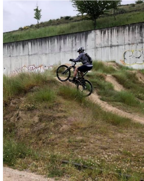
Figura 3 – BTT (circuito do pólis)