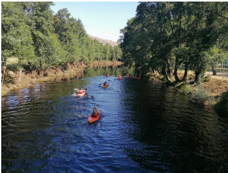
Figura 8 – Canoagem Aldeia Viçosa