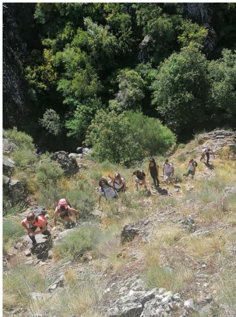
Figura 4 – Pedestrianismo (Rota do javali)