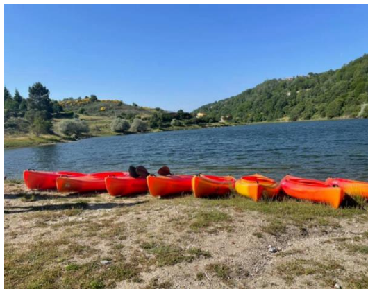
Figura 7 – Canoagem barragem do Caldeirão

A tarefa dos estagiários era não deixar que ninguém fosse para muito longe e ajudar de imediato algum aluno que, por algum motivo tenha caído da embarcação, situação que não aconteceu.