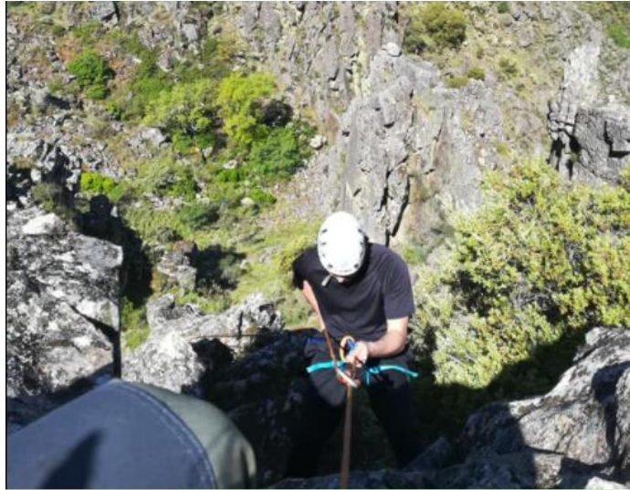
Figura 6 – Rapel Barragem do Caldeirão