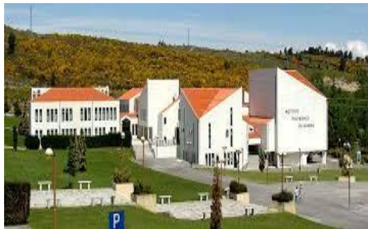
Figura 2 - IPG

O Ensino Superior Politécnico na Guarda é hoje, indiscutivelmente, um fator determinante na luta contra a interioridade e desertificação do interior.