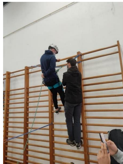
Figura 5 – Rapel IPG