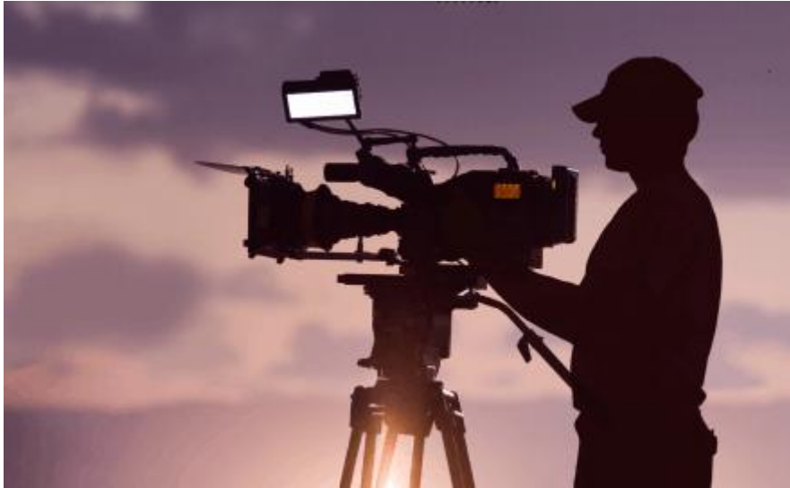
Fig3. Gravação de entrevistas