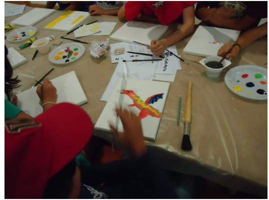
Imagem 5 - Tarde de Pintura