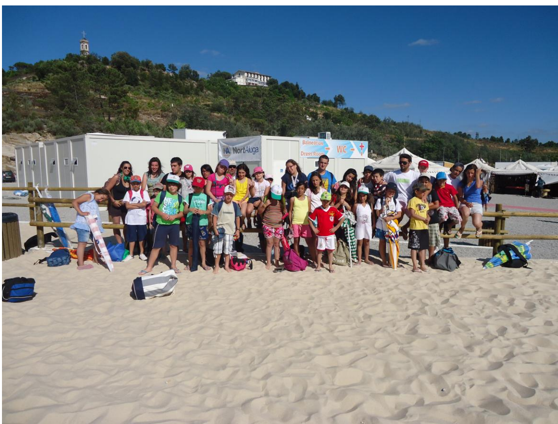
Imagem 2 - Grupo de Jovens das Férias Desportivas

Nas piscinas , observação/vigilância dos utentes que frequentam a piscina e apoio durante a realização das aulas de natação, revalidação ou inscrições dos alunos de natação, junto em anexo vai a ficha de inscrições, Fiz também o inventário do material que existe nas piscinas que vai discriminado em anexo.