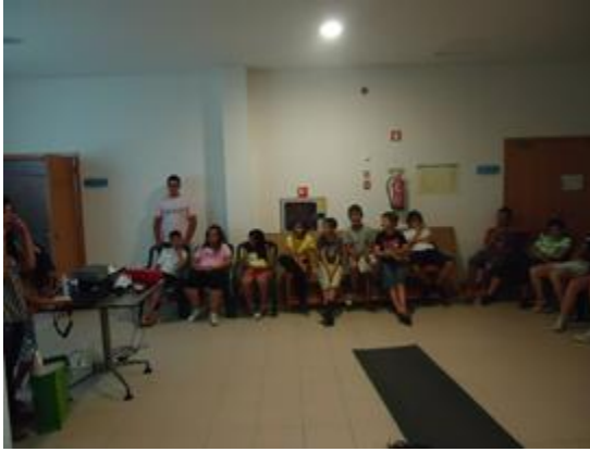
Imagem 4 - Tarde de Saúde