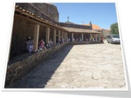
Imagem 3 - Escavações Arqueológicas no Castelo de Alfaiates e Peddy Paper