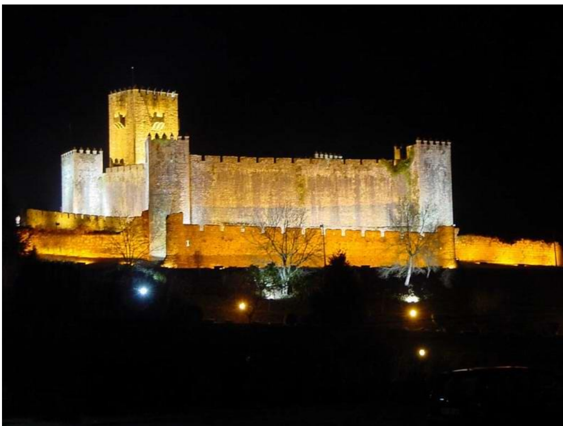
Imagem 1 - Castelo de Sabugal

Foi elevada a cidade em 9 de Dezembro de 2004.