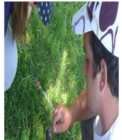
Imagem 7 - BTT e Tarde na TrutalCòa