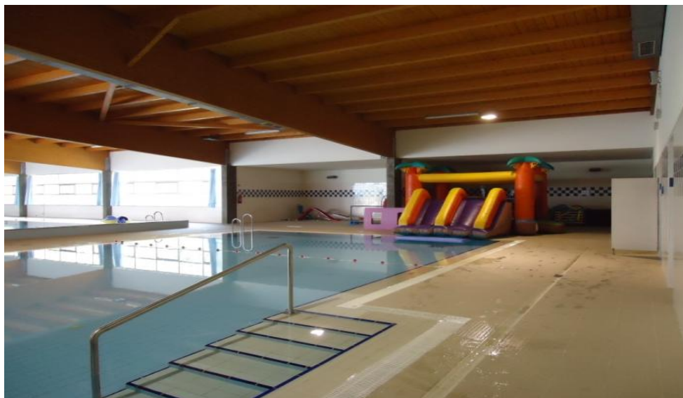
Imagem 8 - Vista Interior das Piscinas