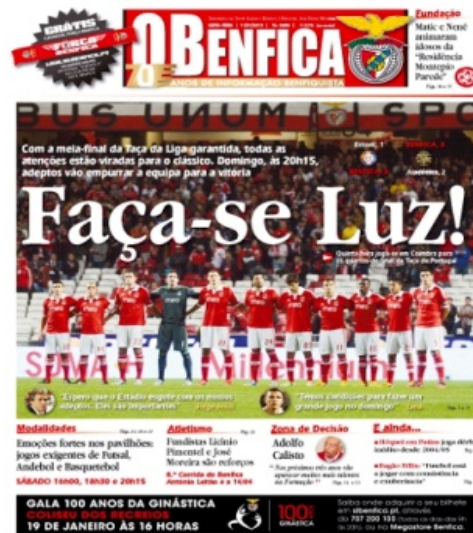
Fig 1: Capa do Jornal “O Benfica”

Situado no Estádio da Luz, na porta n.º 9, o jornal “O Benfica” foi fundado em 1942, pelo Dr. José Magalhães, tornando-se um dos jornais desportivos mais antigos em Portugal e com um carácter institucional. Com uma tiragem semanal de 10.000 exemplares, esta publicação pretende levar aos sócios e adeptos todas as notícias que se encontram no universo do SLB, desde as modalidades desportivas até ao próprio funcionamento do clube, quer em termos institucionais quer em termos financeiros. O jornal “O Benfica” não só possui a exclusividade dos atletas, equipas técnicas do clube e de elementos ligados ao Sport Lisboa e Benfica, como também acaba por ser um elemento fundamental para recolha de informação do próprio clube, por parte dos meios de comunicação concorrentes.