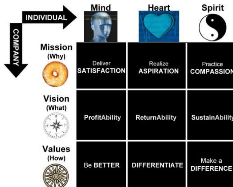
Figura 1 – Modelo de Matriz Baseada em Valores