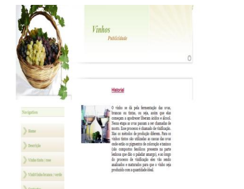
Fig.2 – Página Home.