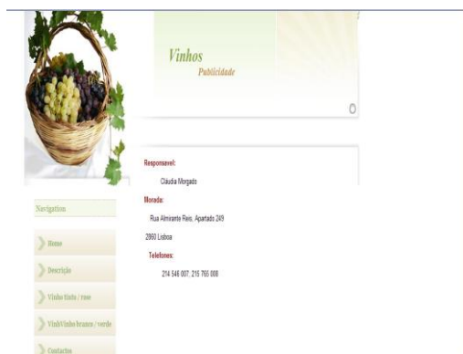
Fig.5 – Página Final Contactos

Nesta altura, o projecto já estava modelado. Alguns objectos sofreram alterações, a fim de manter o projecto de acordo com o plano de estágio.