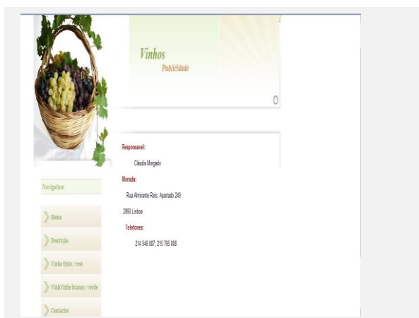
Fig.1 – Criação do Template.