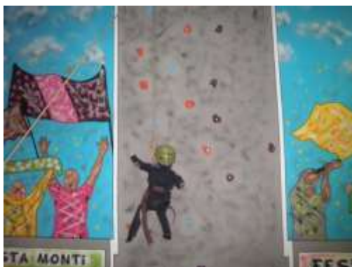
Fig.20- Parede de escalada interior no Parque Temático (fonte própria)