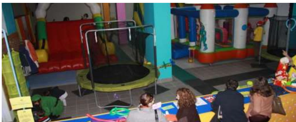
Fig.3 - Vista geral do Parque temático “Pavilhão Multiusos”

A instituição é constituída por um Parque temático que é a sua sede e uma arena interior de LaserTag que é considerada a maior da Península Ibérica, ambos situados na Covilhã, atrás do chinês em frente do Hospital. As figuras seguintes representam o parque temático da empresa, com uma vista geral de dois eventos a ser realizados ao mesmo tempo e a parede de escalada de interior utilizada em festas de aniversário radicais.