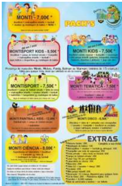
Fig.6 - Festas de aniversário – serviços

Falando novamente do KidsPark (parque temático), a empresa possui um plano de eventos para os clientes, juntamente com um preço para as diferentes festas, como se pode ver a seguir.