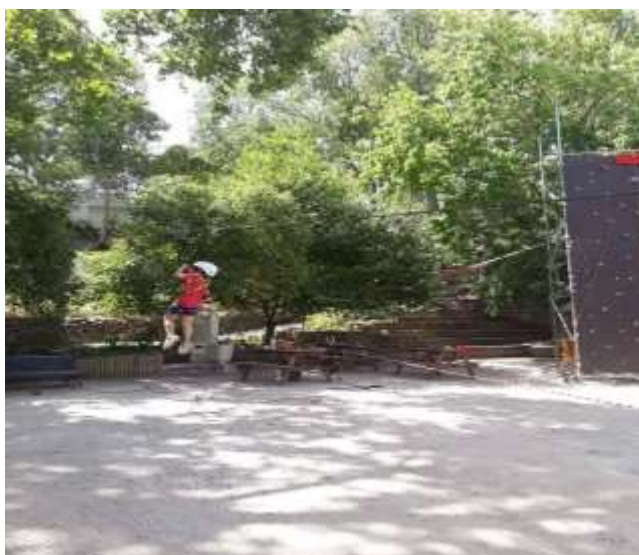
Fig.19 – Evento de exterior, com rappel e parede de escalada artificial