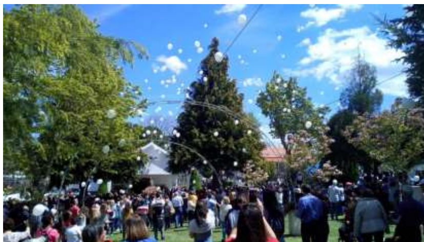
Fig. 17 – Largada de balões em casamento