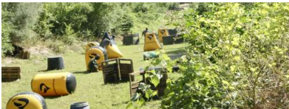
Fig.10 Arena de Paintball montada no exterior

As figuras seguintes demonstram vários eventos realizados, quer paintball no exterior, quer paintball kids no interior do parque temático da Animactiva. Onde podemos observar a preparação dos espaços e a estrutura elaborada, com todos os obstáculos preparados para os jogos, bem como, todo o material e equipamento.