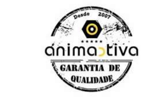
Fig.2 – imagem de marca “Garantia de Qualidade”

A empresa foi premiada também com o selo de “Garantia de Qualidade” o que demonstra bem o seu valor no mercado.