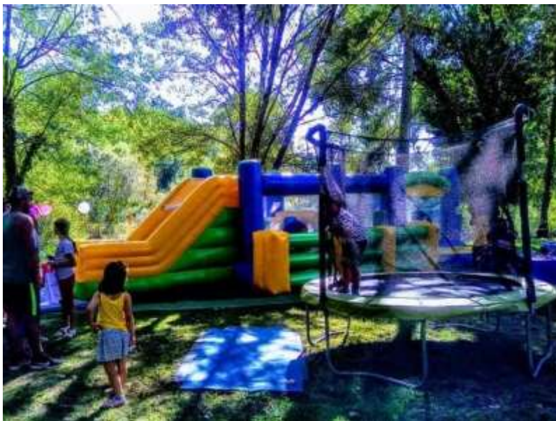
Fig.14 – Festa de aniversário exterior