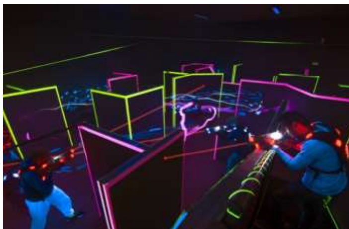
Fig.5 - Arena de LaserTag

A instituição tem como base estes dois espaços (pavilhões), onde são realizadas todas as atividades de interior. Na arena de LaserTag, existe uma idade mínima estabelecida nos 10 anos por segurança dos mesmo e por grau de dificuldade.