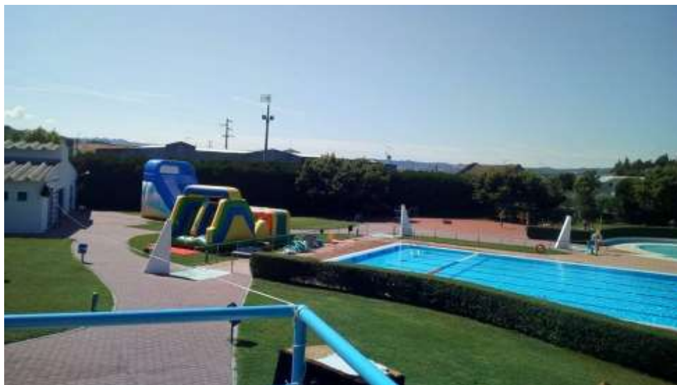
Fig.16 – Evento em piscina municipal de Caria