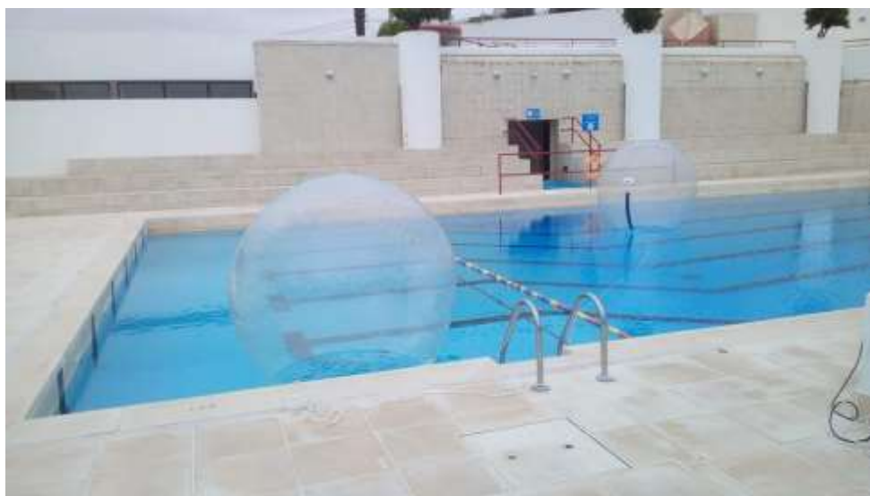
Fig.15 – Waterballs em Mora