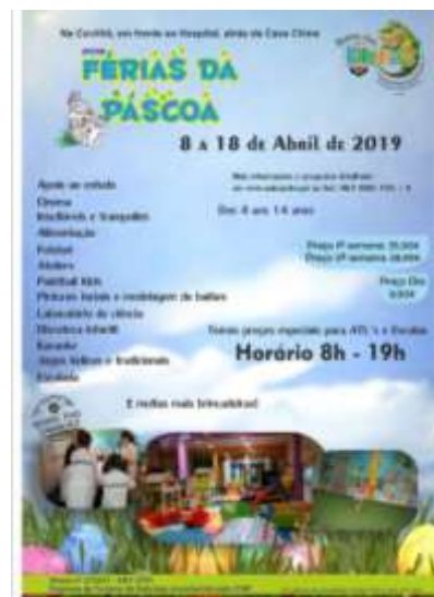
Fig.9 - Férias da Páscoa