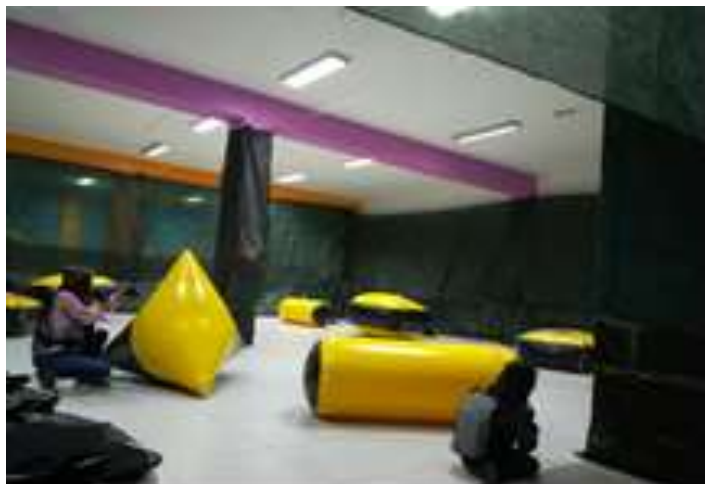
Fig.11 – Arena de Paintball Kids no interior do parque