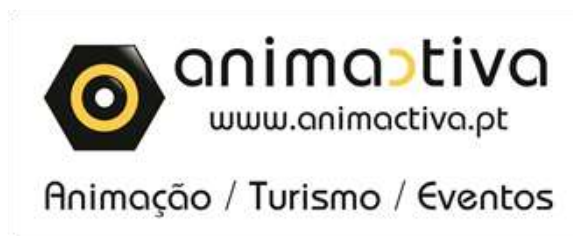
Fig.1 Logotipo da empresa

A empresa possui uma parceria com um conhecido da área de desportos de montanha, Nuno Adriano, fundador da empresa Advventura. A parceria consiste em eventos de montanha, (passeios pedestres, escalada, rotas gastronómicas), serem realizadas com apoio do próprio Nuno Adriano, na organização e realização das atividades.