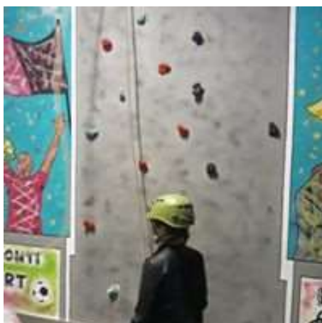
Fig.18- Segurança na parede de escada interior, no parque