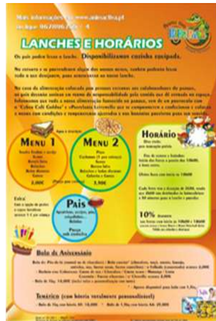
Fig.7 - Lanches e horários