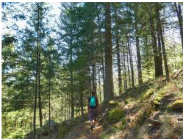
Fig.13 – Foto de peddy paper Serra da Estrela

De seguida encontra-se uma foto com fonte Animactiva, de um evento peddy paper e caminhada na Serra da Estrela, divididos por vários grupos, um conjunto de clientes de uma empresa da área, seguia realizando os desafios e perguntas pela Serra.