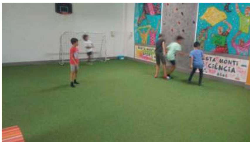
Fig.4 – Foto do fundo do parque com o campo de futebol e parede de escalada