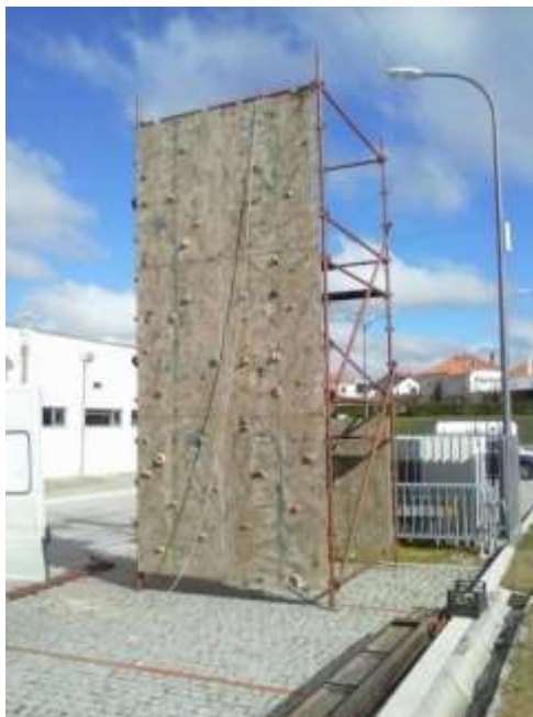
Fig.21 – Parede de escalada

Na figura seguinte está apresentada uma foto da parede de escalada utilizada pela empresa em eventos de exterior, falada anteriormente, que era fornecida pela parceria da empresa com um parceiro independente.