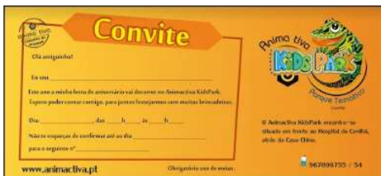
Fig.8 - Convite de aniversário