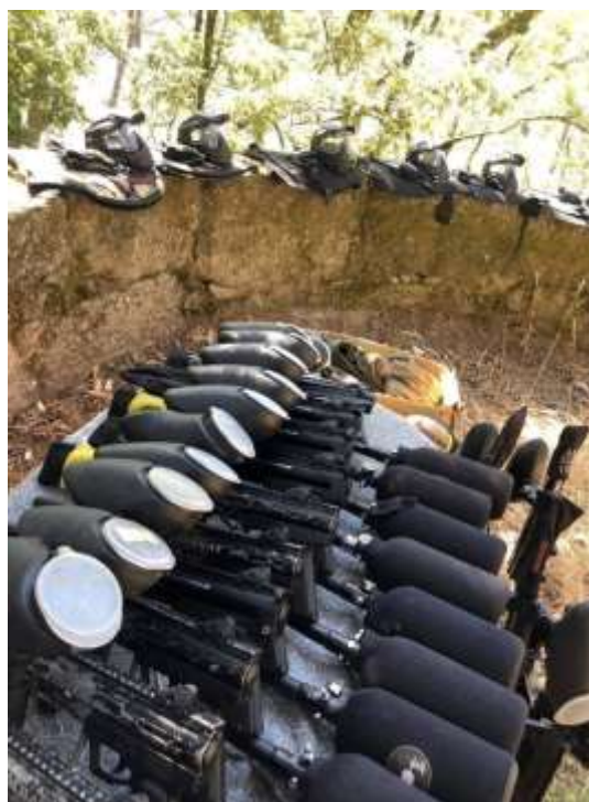
Fig.12 – Material Paintball