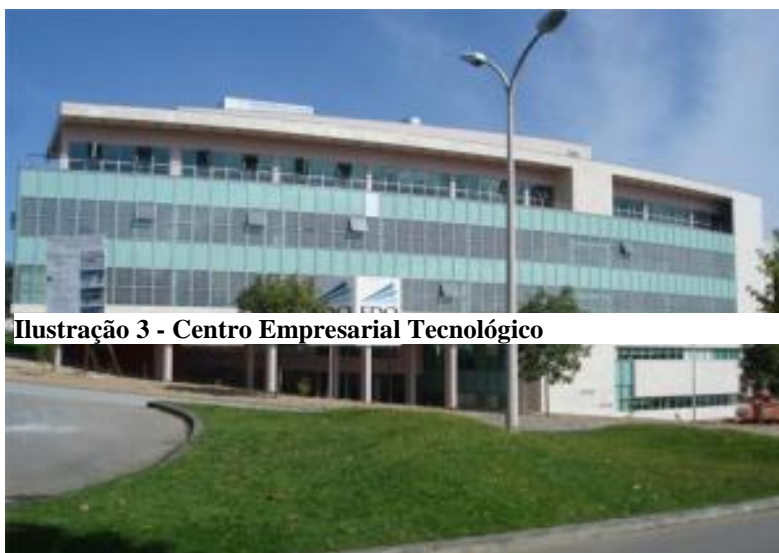
Ilustração 3 - Centro Empresarial Tecnológico

A cidade tem uma forte tradição na área industrial, designadamente na área do calçado. É conhecida como a “Capital do Calçado”, contendo inúmeras fábricas de calçado e de componentes para calçado, bem como o “Centro Tecnológico do Calçado” e o “Centro de Formação Profissional da Indústria do Calçado”.