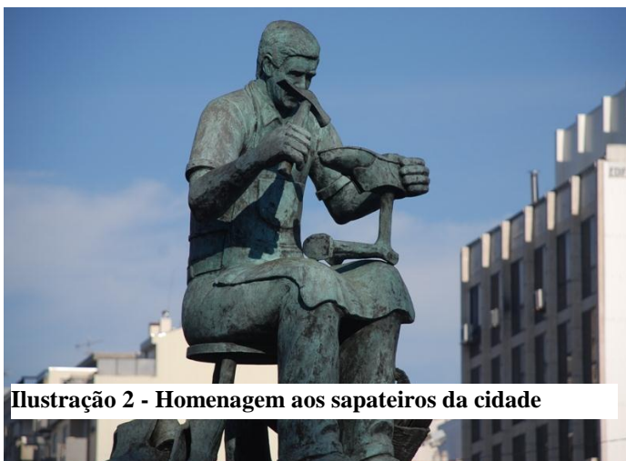
Ilustração 2 - Homenagem aos sapateiros da cidade

São João da Madeira aparece referenciada em inúmeros documentos medievais, datando o mais antigo de 1088, tendo estado ligado a diversas localidades da zona. Até final do