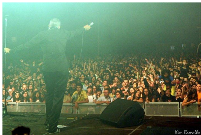
Ilustração 11- 5º dia de Festival GNR

Por volta das 18h00, começam a chegar as pessoas que já sabiam do que se tratava e dirigiam-se à zona de bilheteira para reaverem o seu dinheiro pois não estavam dispostas a ouvir GNR. No entanto, o estagiário tinha ordens de não devolver dinheiro, visto no verso do bilhete as regras do festival serem bem explícitas.