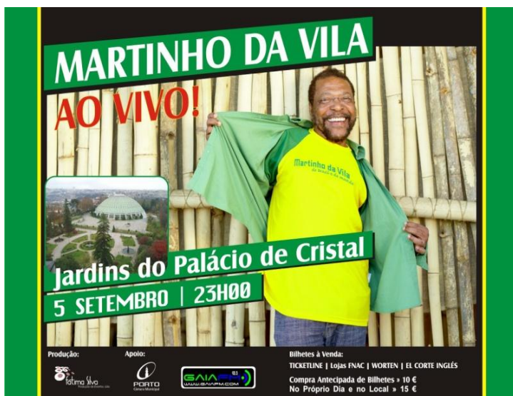
Ilustração 13- Cartaz do concerto de Martinho da Vila

No dia 5 de Setembro de 2010, o estagiário fez parte da produção do concerto de Martinho da Vila, nos Jardins do Palácio de Cristal - Porto. O estagiário teve função de orientar a bilheteira na qual tinha duas funcionárias sob a sua orientação, bem como montar o catering do artista.