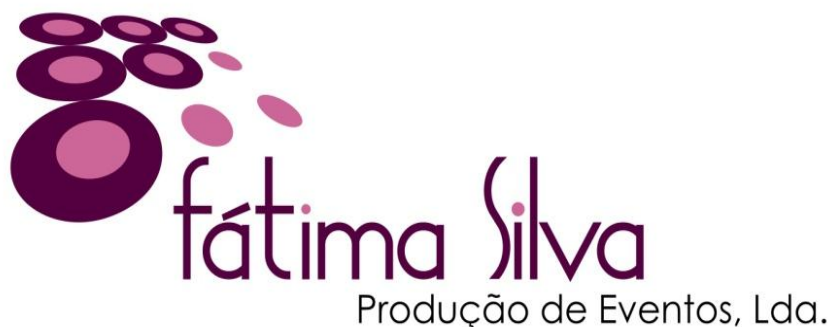
Ilustração 4 - Logótipo Fátima Silva Produção de Eventos, Lda.

Fátima Silva Produção de Eventos, Lda. é uma empresa recente, cuja a proprietária já teve no seu passado outras Empresas na qual realizava passagens de modelos, peças de teatro e serviços de relações públicas, com figuras conhecidas a nível nacional.