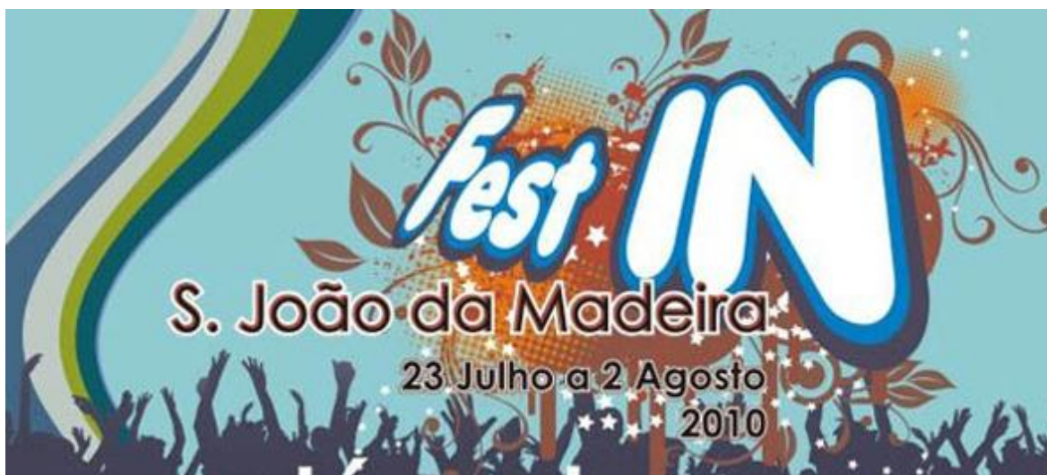
Ilustração 7 - Outdoors existentes por algumas cidades da zona norte do país