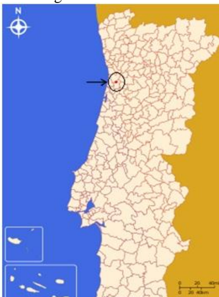
Ilustração 1 - Mapa de Portugal (Cidade de S. João da Madeira)

A cidade é limitada a Norte com a freguesia de Milheirós de Poiares, a Este pela freguesia de Nogueira do Cravo e Macieira de Sarnes, a Sul com a freguesia de Cucujães e Vila-Chã de S. Roque e a Oeste com a freguesia de Arrifana, ambas do Concelho de Santa Maria da Feira.