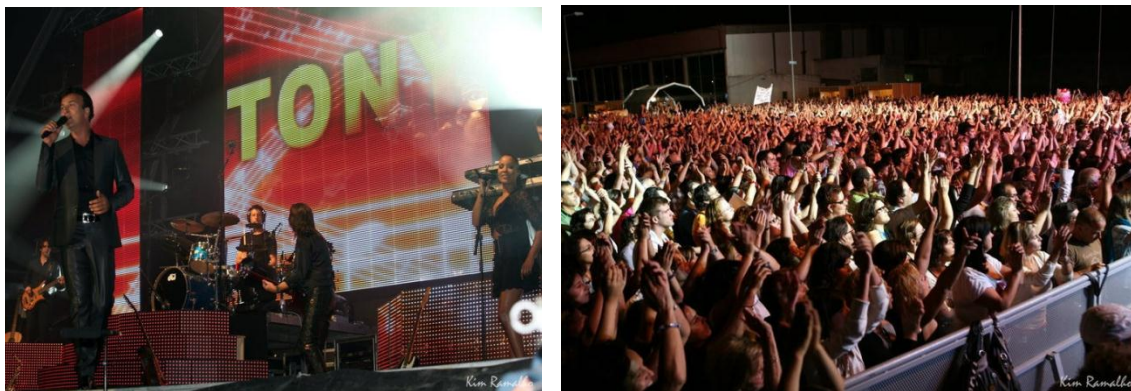
Ilustração 8 - 1º Dia Fest IN Sao Joao da Madeira