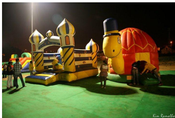
Ilustração 10 - Espaço de Restauração e Lazer

O quinto dia começa bem cedo para a produção do festival. A produção é informada que a banda Xutos e Pontapés não vai poder actuar devido a uma infecção ocular sofrida pelo vocalista da banda Tim. É feita uma análise pelos membros da produção sobre a banda que poderia vir substituir os Xutos e Pontapés, sendo que a conclusão a que chegaram é que os GNR seriam a banda que mais se poderia assemelhar aos Xutos e poderia agradar a todos. É colocada informação na bilheteira da alteração de banda (Anexo II) bem como a declaração médica de Tim (Anexo III).