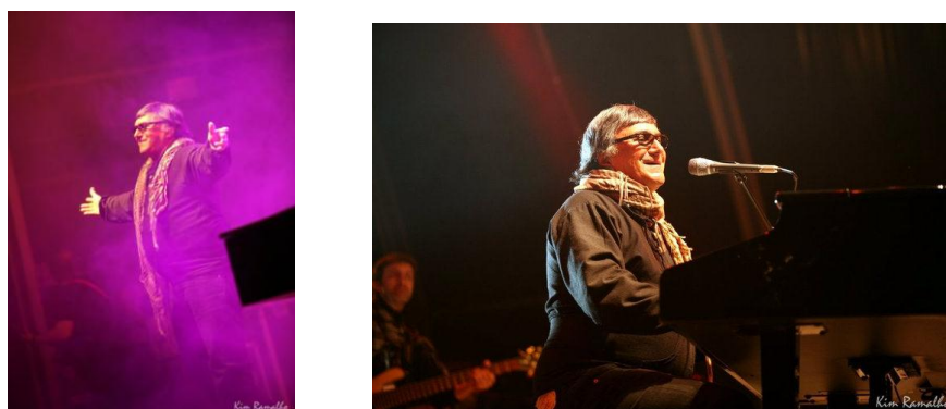
Ilustração 9 - 2º dia Fest IN São João da Madeira

O estagiário em relação ao contacto com o público, tem a noção da necessidade de profissionalismo, na medida em que este festival era destinado ao mesmo, sendo importante ser educado e saber ouvir, assim como esclarecer os clientes.