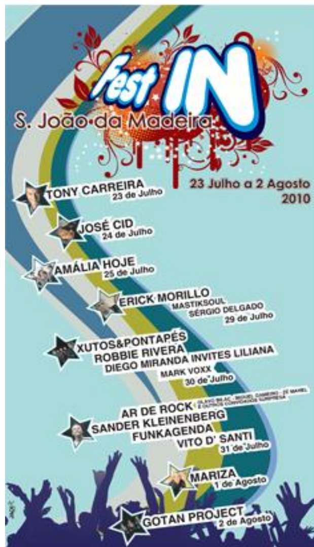
Ilustração 6 - Cartaz Fest IN São João da Madeira

Nas primeiras semanas de estágio, foi proposto ao estagiário estabelecer contactos como órgãos de comunicação social (Revista Nova Gente, Canal UP, Jornal de Noticias, Revista Sábado, Jornal O Regional, Rádio Regional Sanjoanense bem como a RTP) a fim de reforçar a campanha publicitária existente ao festival (Anexo I).