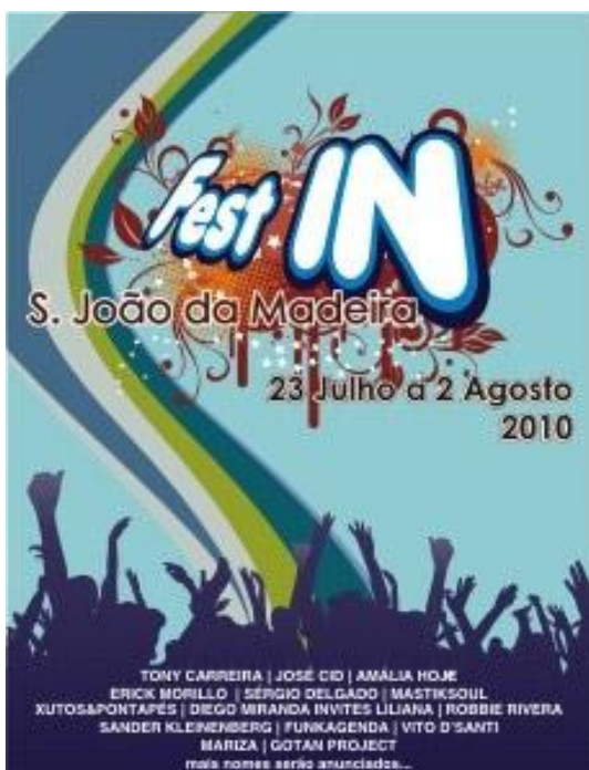
Ilustração 5 - Fest IN São João da Madeira

Actualmente, a empresa a nível de portefólio apenas contém o “ Fest IN São João da Madeira ”, bem como a produção do concerto de Martinho da Vila nos Jardins do Palácio de Cristal no Porto.